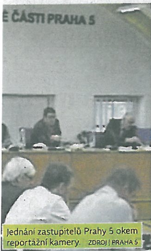
Jednání zastupitelů Prahy 5 okem reportážní kamery

Jestli je i on v hledáčku policie, ovšem není jisté. Nicméně sám státní zástupce Martin Černý připouští, že počet stíhaných nemusí být konečný a prověřují i další zastupitele. „Je jich méně než deset. Posuzuje se případ od případu, každý má svá specifika,“ uvedl. A připouští, že v některých případech to není jednoznačné. „Je rozdíl i v tom, jestli se jedná o klasický pracovní poměr, nebo třeba o několik částečných úvazků,“ uvedl.